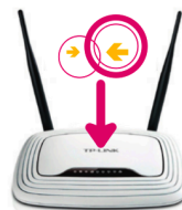
Ein neuer Freifunk-Router