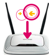
Ein neuer Freifunk-Router